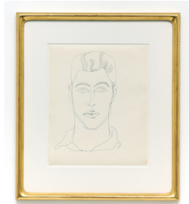
Andy Warhol ohne Titel , 1956/57 Kugelschreiber auf Papier 43,7 x 35,8 cm

Anders ist das bei dem Werk von Jack Pierson: zwar ist das Bild in seiner Inszenierung und dem gewählten Ausschnitt durchaus typisch für seine künstlerische Handschrift, doch liegt es in der Natur des Mediums, das es eher wie eine nüchterne Bestandsaufnahme des Gesehenen wirkt. Wäre die Größendarstellung des abgebildeten Körpers in der Jeans nicht jenseits der Realität, wären wir uns vielleicht nicht einmal der Abbildhaftigkeit des Werkes, seinem Stellenwert als Artefakt bewusst. Es gibt zwischen Werk und Betrachter keinerlei Distanz mehr und der Blick wird hier zu einer nahezu haptischen Erfahrung.