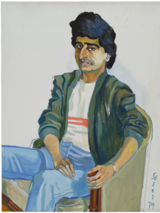
Alice Neel Cyrus the Gentle Iranian , 1976 Öl auf Leinwand 101,6 x 76,2 cm