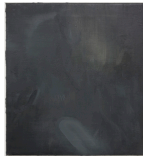
David Schutter AIC G 219 , 2014 Öl auf Leinwand 41 x 37,8 cm

Der Ausgangspunkt eines jeden Werkes von Schutter ist die intensive Auseinandersetzung mit älteren Gemälden. Meist sind es niederländische oder französische Gemälde vergangener Jahrhunderte die er akribisch analysiert, doch verrät das kryptische Akronym des Werktitels zu wenig, als das ein Zusammenhang mit dem Referenzbild sichtbar würde. Schutter erforscht vor Ort im phänomenologischen Sinne die Erfahrung, die er bei der Betrachtung des Werkes macht und überträgt diese, und die analytische Beschäftigung mit den Umständen seiner Entstehung, in sein eigenes Werk.